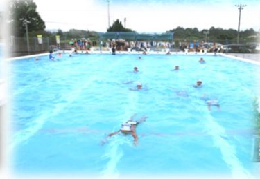
痛んでいたプール、 よくなりました。