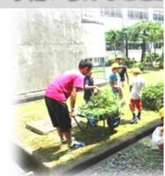
環境美化活動で学校をきれい