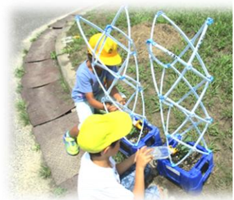
植物のお世話をがんばり

7月11日(月)6年生の善っこ(総合の学習)の時間に、劇団「こなんヒストリア」さんに来ていただき、劇を通して、菩提寺のことを学びました。子どもたちが実際に歩いて見学した場所も紹介され、興味深く鑑賞をしていました。