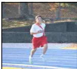
*4区 H.I さん*