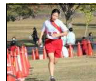
*5区 T.Y さん*