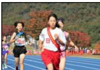
*1区 A.T さん*