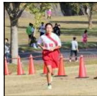
*3区 S.K さん*