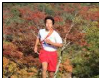
*5区 A.M さん*