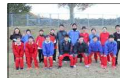
* ONE HEART ONE TEAM *