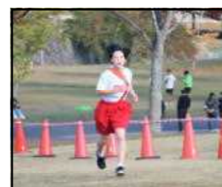
*4区 H.T さん*