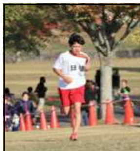
*2区 S.F さん*