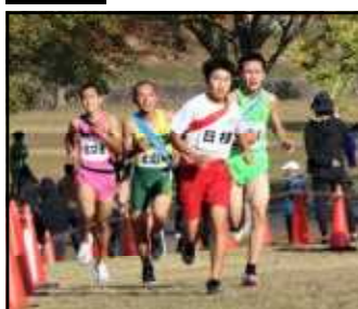
*1区 K.M さん*