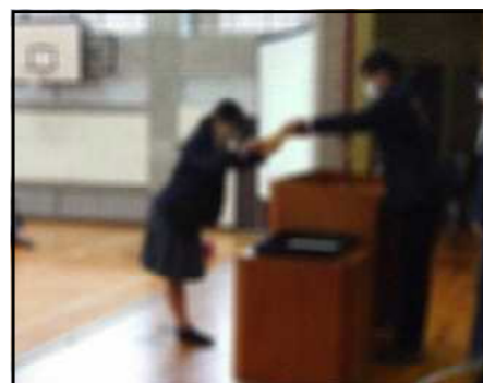
表彰伝達の様子です。本来ですと、石部文化ホールに受賞者が一堂に会し表彰を受けていましたが、コロナ禍で各校での表彰伝達となりました。