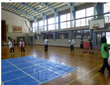
おじゃピンゴ、楽しかったね！