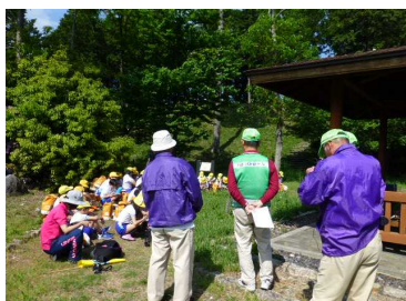
あけぼの公園の古墳のお話

5月8日、晴天の中（暑すぎるぐらいでした...）子どもたちは石部の町を歩きました。一緒に歩いてくださったボランティアのみなさま、ありがとうございました。