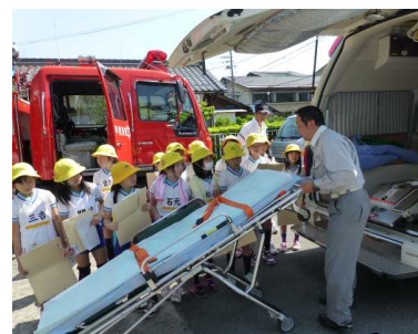
湖南消防石部分署にて、消防車・救急車のしくみについて