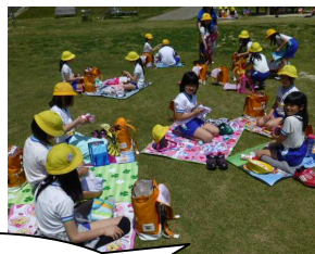
おにぎりの中は何か？