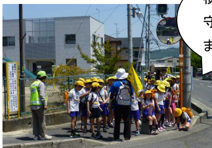
横断歩道で見守って下さいました。