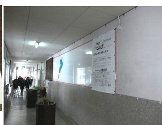
職員室の壁を鉄板掲示板に