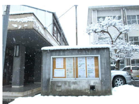
校報掲示板を新しく

後援会費は、各自治会で取り扱ってくださっていることから、自治会に入っておられない方からは「知らなかった。」という声も聞いています。そこで、校報17号に続き本年度の教育後援会費を使った内容を、御礼の気持ちを込めて報告します。