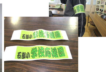
学校応援団の腕章作成