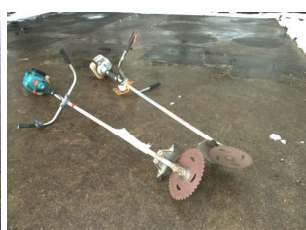
草刈り機の歯の購入