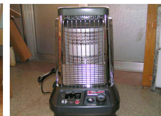
体育館用ストーブ(2台)