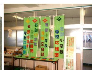
学校応援団のぼり旗作成