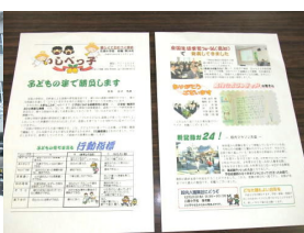
校報の紙代・インク代