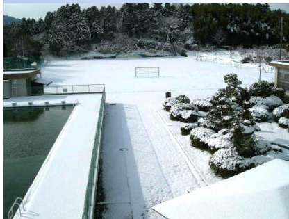
運動場も一面の銀世界