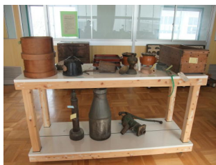
郷土資料室の展示台制作