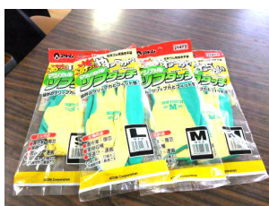
環境ボラさん使用の軍手