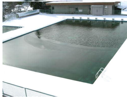
校舎側の水面が凍ったプール

大晦日の大雪がうそのように晴れ渡った元旦。一年の汚れを落とし、一面の銀世界の中で新しい年を迎えました。