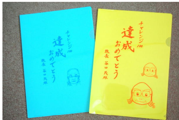
チャレンジ100を達成すればもらえるクリアファイル

学校全体としては、「詩の完璧暗唱」や「チャレンジ100」に取り組んでいるのですが、子どもによって取り組みの熱意が違うのも事実です。ご家庭でもはげましの言葉がけをお願いします。