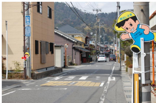
「飛び出し坊や」の設置も