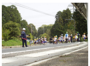
甲賀警察署の方も

一緒に歩いてくださった方49名、安全確保のために見守ってくださった方46名以上、説明してくださった方5名、警察の方8名、名前を確認できる方だけで108名。教職員を含めると137名以上が関わっての実施となりました。お世話になりました皆様にお礼申し上げます。