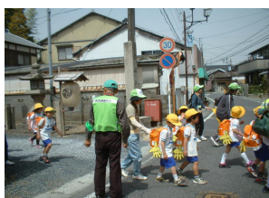
たくさんの方の見守り