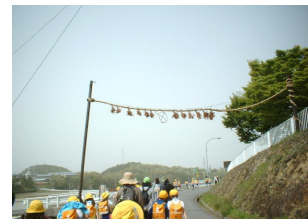
西寺・勸請縄吊をくぐる