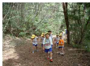
五軒茶屋→雨山の山中