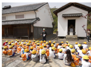
石部歴史民俗資料館