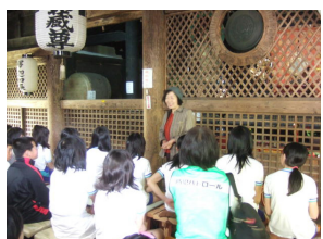
本堂でお話を聞く