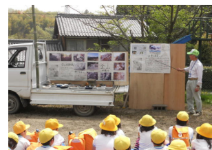
石部・金山の話聞く