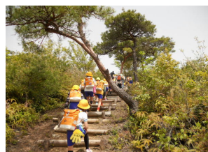
臥龍の森・雨山山頂へ