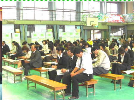
PTA・学校応援団からもたくさんの参加