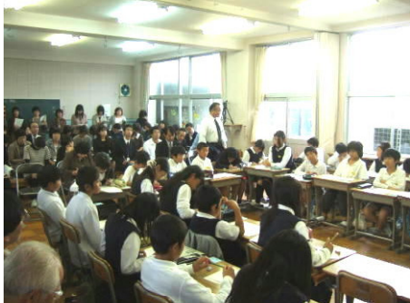
研究授業(6A)は、超満員の参観者