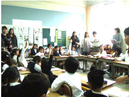
全学級で道徳の授業を公開しました

援助者 … PTA役員: 32名、学校応援団: 27名(講演会に参加)、石部交番(交通整理)