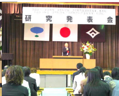
押谷教授による講演