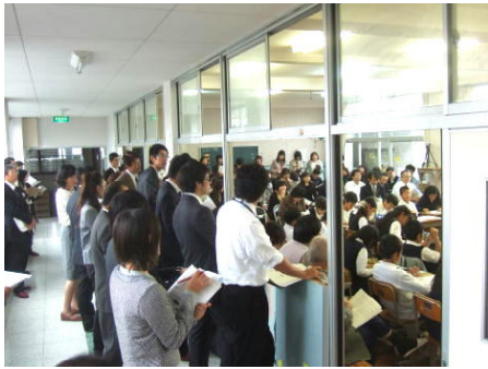
廊下にも、参観者があふれています