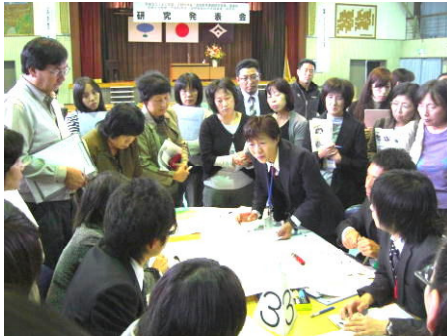
授業分析会の様子を公開しました