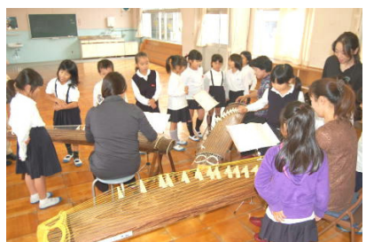
琴の譜面を初めて見たよ…琴クラブ