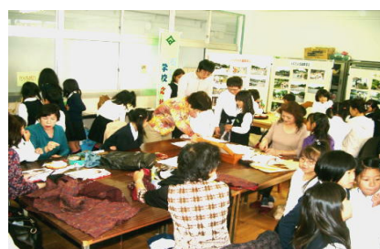
何が出来るのかな…洋裁クラブ