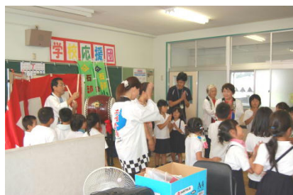
江州音頭の練習…石音会