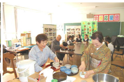
結構なお点前…茶道クラブ