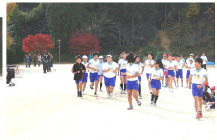
仲間と一緒に走り、ゴールイン