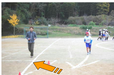
応援のため走ってくれたお父さん