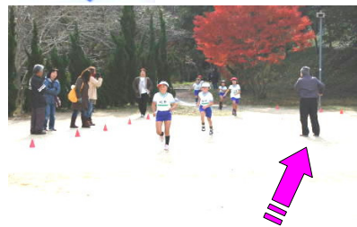
「腕を振れ！」と応援する地域の方