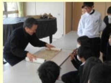
【絵巻物として見ている様子】

がよく分かります。絵は丁寧に細かく描かれていて、子どもたちは驚きの声を上げていました。その後図工室で、コピーされた本物を見ながら一人ひとりが墨と筆で模写に挑戦しました。学芸員の方に墨や硯、筆の使い方を説明していただき、練習描きをしてから本番に挑みました。そうすると、な・な・な・なんと子どもたちは、本物かと思うほど素晴らしい作品を描いてくれました。子どもの能力は無限であると感じた瞬間でした。このような活動を行うことにより、教科書に書いてあるお話がより身近なものになり、筆者が書いている「鳥獣戯画」が「漫画の祖」「アニメの祖」であることが実感できるのだと思います。更にこれが日本文化の特色であり、12世紀から今日まで続く、絵と言葉の力で物語を語り、子どもから大人までが楽しめる世界に類を見ない作品を作り出してきた国宝であり、人類の宝であることが分かるのです。