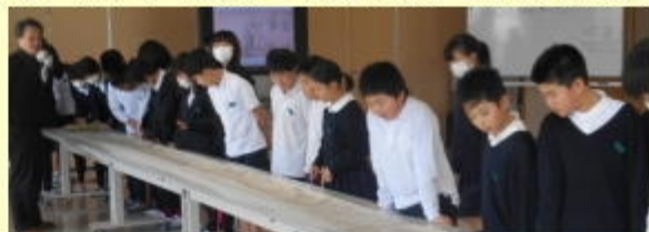
【実物大のレプリカに見入っている様子】