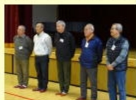
【「スーパー竹とんぼ」さん】

る子が何人もいました。竹とんぼは全員分を「スーパー竹とんぼ」さんが作ってきてくださいました。他の遊びも全員が体験しましたが、夢中になって遊んでいました。「スーパー竹とんぼ」さんどうもありがとうございました。