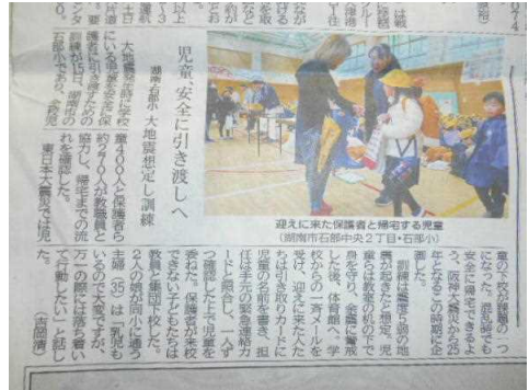
1/16(木)京都新聞朝刊で取り上げていただきました。「大地震想定し訓練」

この2点について、「大変すばらしかったです。」とおほめの言葉をいただきました。とても励みになり、今後も実効性のある訓練の実施に努めていかなければと強く感じました。