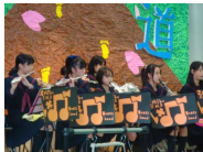
吹奏楽部 日頃の成果！ 生徒会 引き継ぎ式