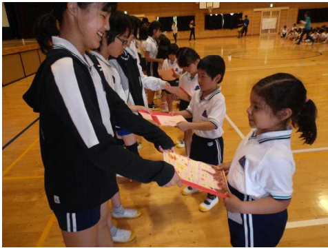
6年生からの手作りプレゼント

到着してからお弁当をペアで食べた後、みんなで親水公園の芝生で思う存分遊びました。少し、暑い天候でしたがみんな元気に過ごせました。この行事で、きょうだい学級の「絆」が深まったことを実感できました。