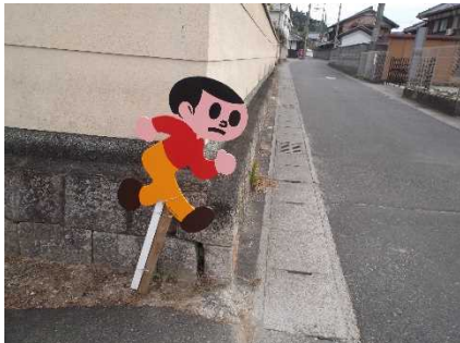
[グラウンド東側出入口]

「岩根小学校教育後援会」の協力金として地域の皆様からの財政支援をいただき、10月に安全安心援助費として「とびだしぼうや」を購入し、学校前2カ所に設置しました。