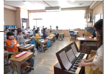
[1年生合唱練習の様子]