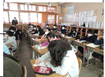
[6年生鑑賞カードへ記入]