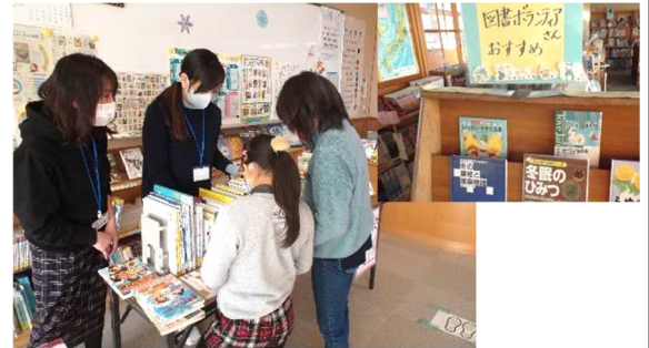
[読書ボランティアによる支援]

学校では教員や学校司書以外にも、地域の読書ボランティアの方に子どもが読みたくなる図書館になるよう環境整備や子どもの貸し出しの支援等をしていただいています。寄付いただいた新しい児童用図書も加わり、更に図書室の環境が充実してきました。