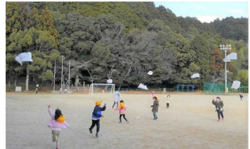
【1/13 運動場で凧揚げをする1年生】

新しい年を迎え、1月6日に冬休みが明けました。おかげをもちまして、大事なく児童が登校することができました。本年もどうぞよろしくお願ひ申し上げます。