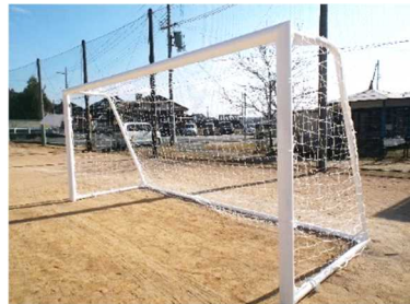
[河本文教福祉振興会からの贈呈本][12/3 サッカーゴール納入:滋賀銀行より]