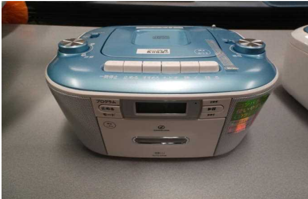
音楽の授業や運動会ダンスに使用するCDラジカセを購入させていただきました。

このように教育後援会は、子どもたちの学習環境・整備の推進となり、より深い学びの獲得に大きな支援をしていただいています。本当にありがとうございます。引き続きのご支援とご協力をよろしくお願いいたします。