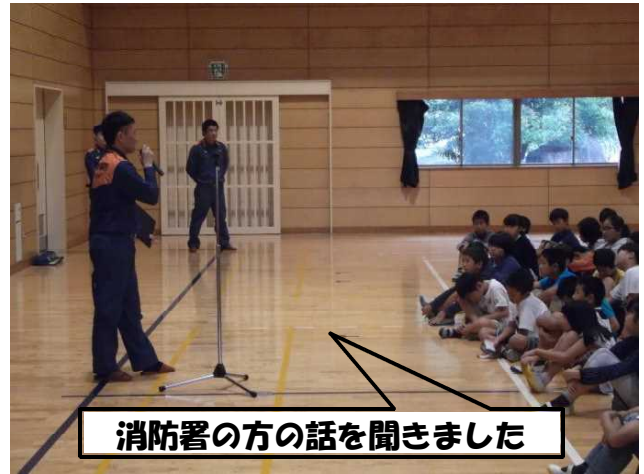
消防署の方の話を聞きました

最後には、防災アドバイザーとして消防署の方に、避難についてのお話をいただきました。次につながる訓練になったと思います。