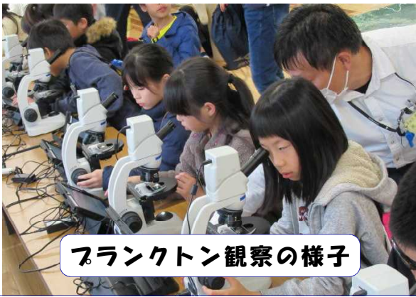
フランクton観察の様子

2日間の活動を通して子どもたちは、「びわ湖」に関する環境学習、長浜市の様子、他校の子どもたちとの交流等で、新しい学びや友情を培うことにつながりました。