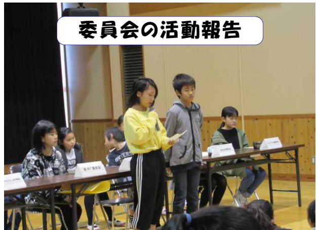
委員会の活動報告

12月13日(木)の6校時に、2回目の「岩根っこ総会」を行いました。各委員会の委員長、副委員長が、これまでの活動の報告や反省点などを報告しました。それを受けて、質問やしてほしい活動等の要望、委員会への感謝を聞いている3～6年生児童が、発表します。感謝の言葉を言われると、委員会の意欲が高まり、さらに委員会活動が活性化して、子ども自らが高まっています。