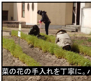
菜の花の手入れを丁寧に。パンジーはもう美しく咲き誇っています