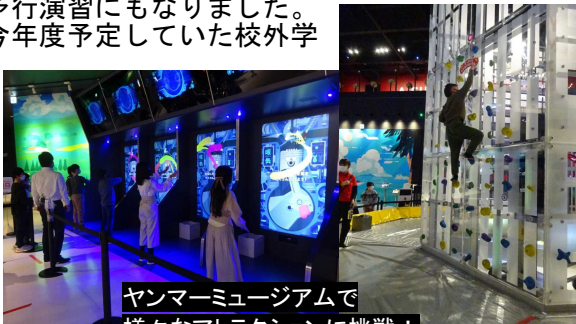
ヤンマーミュージアムで様々なアトラクションに挑戦！