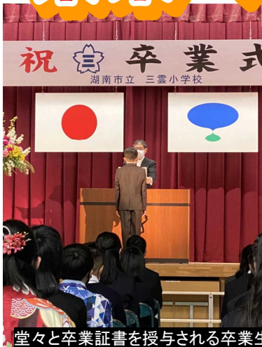
堂々と卒業証書を授与される卒業生

3月18日(金)本校卒業式を無事行うことができました。新型コロナウイルス感染防止対策のため、参加者を限定した式となりましたが、卒業生や在校生代表で出席した5年生の凜とした姿が、厳粛な式を見事に創りあげてくれました。