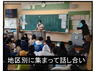
地区別に集まって話し合い

翌11日から、新分団長が先頭に立って登校を実施しています。次年度もしっかりお願いしますね。