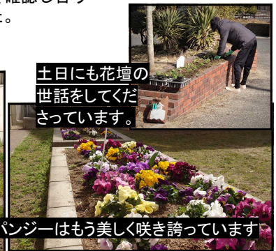
土日も花壇の世話をしてくださっています。