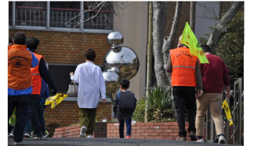
ボランティアさんが付き添って親子で登校練習

地域ボランティアの皆さんの手で始められたこの取組も今年で5年目。まちづくり協議会の取組としても定着し、今年からは青少年育成会議の皆さんも加わっていただき、多くの地域の皆さんが関わってくださっています。地域で子どもたちの安全を見守り、親子で通学路の危険箇所を確認し合う素敵な活動になりました。