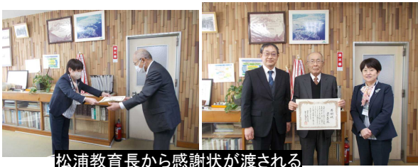
松浦教育長から感謝状が渡される

例年であれば、石部文化ホールに市内関係者が一堂に会しての式典を開催し、その中での贈呈となるのですが、コロナ対策で教育長が各校を訪問しての贈呈となりました。