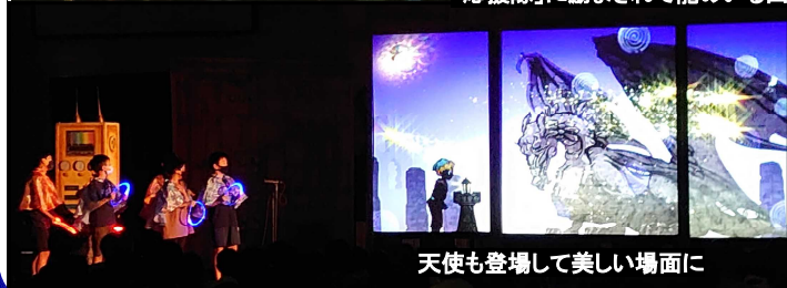
天使も登場して美しい場面に