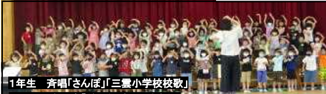
1年生 斉唱「さんぽ」「三雲小学校校歌」 合唱奏「どんぐりさんのおうち」