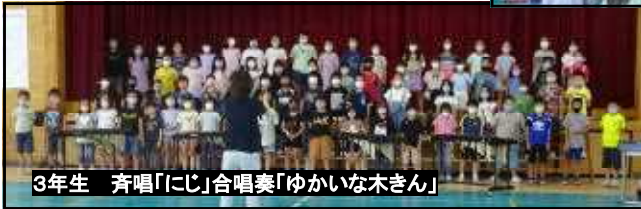
3年生 斉唱「にじ」合唱奏「ゆかいな木きん」