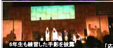
6年生も練習した手影を披露