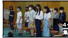
4・5・6年生の執行委員のみんなが集会の司会進行を行いました。