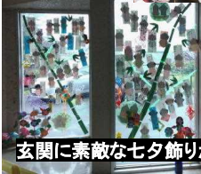
玄関に素敵な七夕飾りができました

以前からお伝えしていますように、本校にはたくさんボランティアの皆さんが関わってくださっています。先日の七夕の日には休み時間に折り紙教室を開いてくださって、子どもたちと玄関の七夕飾りをつくっていただきました。