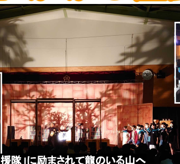
「応援隊」に励まされて龍のいる山へ