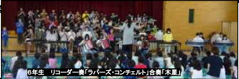
6年生 リコーダー奏「ラバース・コンチェルト」合奏「木星」

昨年度は中止した音楽会。今年は1年生と4年生、2年生と5年生、3年生と6年生という2学年ずつの分散した「音楽集会」として開催しました。ステージの様子は個別懇談の待合所でVTR放映しますので、是非ご覧ください。