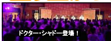
ドクター・シャドウ登場!