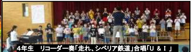
4年生 リコーダー奏「走れ、シベリア鉄道」合唱「U & I」