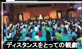
ディスタンスをとっての観劇