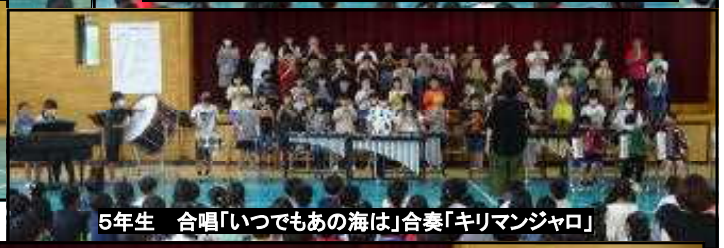
5年生 合唱「いつでもあの海は」合奏「キリマンジャロ」