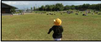
広場と遊具で思いっきり遊んで