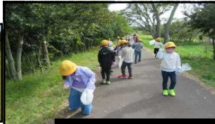
森の中で「秋みつけ」