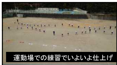
運動場での練習でいよいよ仕上げ