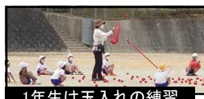
1年生は玉入れの練習