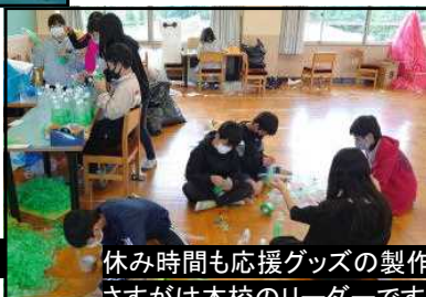
休み時間も応援グッズの製作をがんばる6年生。さすがは本校のリーダーです!