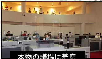
本物の議場に着席