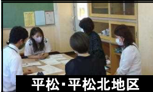
平松・平松北地区