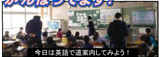
今日は英語で道案内してみよう!

高学年では教科としての英語学習が始まっていますが、本校では英語専科の七里教諭を中心に楽しい学びが広がっています。5年生では、英語で色々な先生に「Can you ~ (～できますか)?」とインタビューして回っていました。現単元では道案内やそれを応用した宝探しなどに挑戦する予定です。おうちでも一度子どもさんと英語での会話に挑戦してみたいはいかがですか。