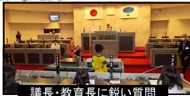
議長・教育長に鋭い質問

10月20日、3年生が社会科の学習で湖南省役所を訪問しました。サンライフ甲西で、市役所の仕事について市役所の方からお話を聞いたり、実際に市役所の中を見学させていただいたりしました。議場では実際に議員席に座らせていただき、議長さんや教育長さんに直接質問する機会を設けていただきました。議長に指名されて、質問台に移動して質問し、教育長が挙手して指名され回答する、といった本物の議会さながらの貴重な体験ができました。市役所の皆さんも、将来の「有権者」の学びに目を細めておられました。