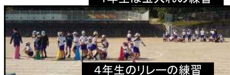
4年生のリレーの練習