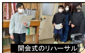
開会式のリハーサルもバッチリ!