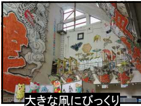
大きな凧にびっくり

10月11日に1年生が校外学習で東近江大凧会館と守山市のびわこ地球市民の森に行ってきました。緊急事態宣言解除後初めてのバス利用の校外活動です。びわこ地球市民の森では、広い芝生でのびのび遊ぶ姿が印象的でした。