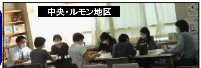
中央・ルモン地区

いくつかの分散会に分かれて討議された地区もあります。写真は一部分だけの紹介になってしまいましたが、会場の熱心な雰囲気は伝わるのでは?