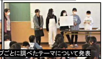
グループごとに調べたテーマについて発表