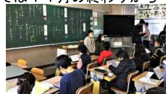
3年生での研究授業。職員もタブレットを持って、よりよい授業づくりを考えます。