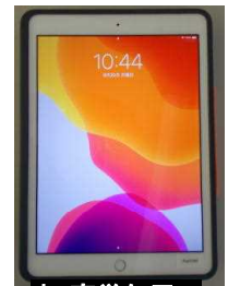
中・高学年用の タブレット端末