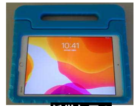
低学年用の タブレット端末

ですから、今回の準備も丁寧に進めていく必要があると考えています。一方で、万が一の事態に備えることは必要ですし、この仕組みを活用した学習保障も可能性を持っています。初めての仕組み作りでもあり、準備の中で出てくる不具合を一つひとつ解決しながら進めることになるかもしれませんが、子どもたちにとって「いい仕組みができた」となるよう、各ご家庭のご協力をお願いします。