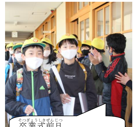
卒業式前日 1～4年生による歓送