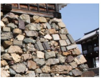
転用石がたくさん使われている 福知山城の石垣は、転校生の多い水戸小のようです。

個性豊かな子どもたちが、その持ち味を生かしつつ、がっつりとスクラムを組む姿は、コミュニティ・スクールが目指している「つながる力」を具現化したものではないかと思えます。卒業生が残した「伝統」を受け継ぎ、1～5年生の子どもたちと教職員が一丸となって、未来に向かってトライすることを心に誓った一日でした。