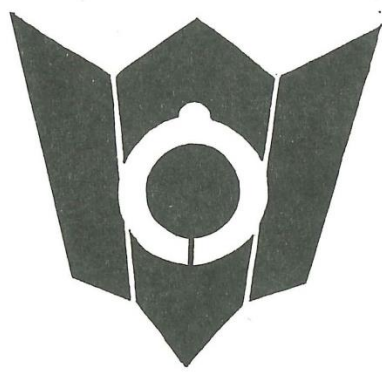
水戸の「水」と、小学校の

昨年の広報「こ うせい」9月号の 募集要項によって 応募された作品は 校章48点（うち町 内応募作品18点） 校歌20点（うち町 内応募作品7点） にのぼり、いずれ も秀作、力作が多 く、審査員のみな さんの審査にも力 が入りました。校 章、校歌の各々で 入選1点、佳作3 点選ばれ、入選 作品については、 文教関係の代表者 で構成する選定委 員会でそれぞれ校 章、校歌として正式に決定され ました。