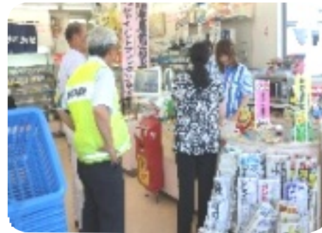
県内一斉補導・巡回指導

おもな活動としては合同街頭補導です。この活動は補導(委)員2〜3名と湖南省少年センター職員および甲賀警察署生活安全課少年補導職員が合同で一組になり、少年の出入りが多い時期と時間帯を中心に巡回し、非行少年の早期発見・補導を行っています。23年度は55回組まれています。