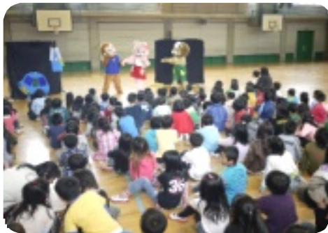
着ぐるみ人形啓発劇

勤務や日々の地域での活動を割いてのボランティア活動です。補導(委)員の活動をとおして、少年たちが健やかに育っていると思っています。感謝。