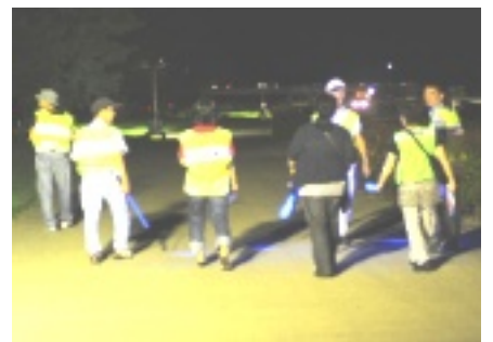
湖南省夏祭り巡回指導

心に着ぐるみ人形で「万引防止」「誘拐防止」の啓発劇を演じたり、甲賀警察署とともに「薬物乱用防止教室」を開いて、有害環境の浄化と非行防止に努めていただいています。