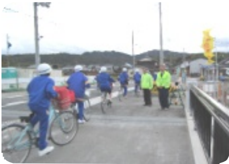
中学校区別の活動

また、7月には、青少年の非行・犯罪防止運動の一環で、湖南省青少年育成市民会議の皆さんと合同で、市内の書店とコンビニエンスストアに協力をお願いしました。さらに、直接市民の皆さんに触れていただくことはありませんが、市内保育園・幼稚園・小学校を中