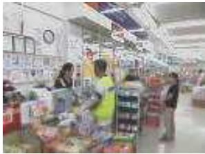
県下一斉補導・巡回活動