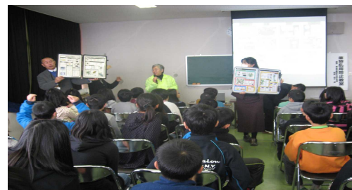
薬物乱用防止教室