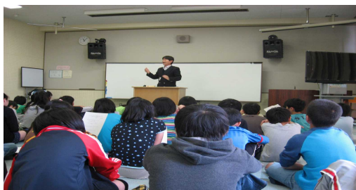
防犯教室「携帯電話」

受け入れられてこそ、向き合ってもらってこそ、安心が得られる。自信が持てる。大人であるみなさんご自身もそうではありませんか？