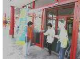
社会を明るくする運動