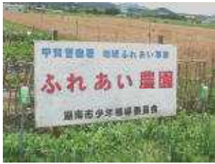
地域ふれあい事業

青少年の非行・被害防止のためには、家庭・地域とともに子どもを守り育てることが大切です。