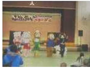
女性部着ぐるみ人形劇