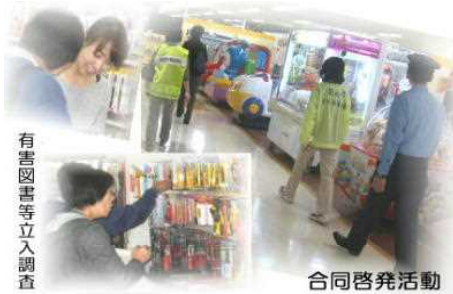
有害図書等立入調査

11月の一ヶ月間、全国一斉に子ども・若者健全育成のための諸事業、諸活動が集中的に展開されています。