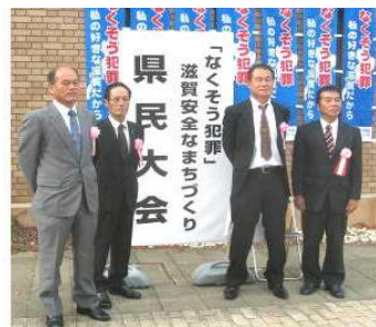
甲賀市少年補導委員さんと一緒に記念撮影 (左から二人目)

朝の登校風景を中心に述べましたが、命・人権に関することや、勉強に関すること等も同じです。 「子どもの自覚」を大切にして、保護者の皆さん・地域の方々と共に子どもを育てて行いたいと思いますので、ご協力をどうぞよろしくお願ひいたします。