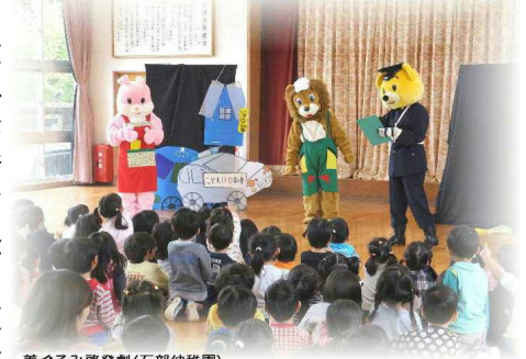
着ぐるみ啓発劇(石部幼稚園)

「少年の非行」「いじめの問題」「児童虐待」「児童ポルノ」など、子どもが犯罪の被害者となる痛ましい事件等が相次いで発生しています。また、インターネット上には出会い系サイトなど違法・有害な情報が氾濫し、携帯電話やスマートフォンの普及により、これらの情報は簡単に青少年の目に触れるところとなっています。他人に知られずに手軽に売買出来ることから、危険ドラッグなどの売買にも使われています。