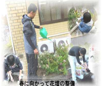
春に向かって花壇の整備