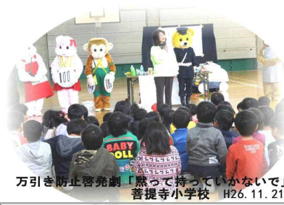
万引き防止啓発劇「盗って持っていくないで」 菩提寺小学校 H26.11.21