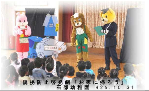
誘拐防止啓発劇「お家に帰ろう」 石部幼稚園 H26.10.31