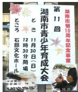
会場正面の大看板を作成しました。