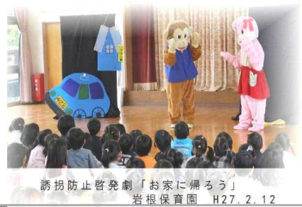
誘拐防止啓発劇「お家に帰ろう」 岩根保育園 H27.2.12