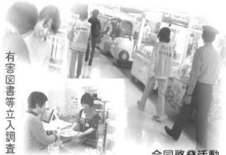
有害図書等立入調査

湖南市少年センターにおいても、少年補導(委)員会女性部による着ぐるみ啓発劇(誘拐防止・万引き防止)や、甲賀警察署の少年補導職員、滋賀県甲賀健康福祉事務所の職員、市内の県立学校の生徒指導担当教員が合同で、市内各種店舗を巡回し、万引防止のための工夫や有害図書等の販売・陳列方法の改善のお願い等を通して、健全育成への取り組みを強化しています。