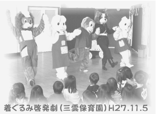
着ぐるみ啓発劇(三雲保育園)H27.11.5

「少年の非行」「いじめの問題」「児童虐待」「児童ポルノ」など、子どもが犯罪の被害者となる痛ましい事件が相次いで発生しています。また、インターネット上には出会い系サイトなど違法・有害な情報が氾濫しています。携帯電話やスマートフォンの普及により、これらの情報が簡単に青少年の目に触れるところとなっています。危険ドラッグなど薬物の販売にも、他人に知られずに手軽に販売できることから利用されています。